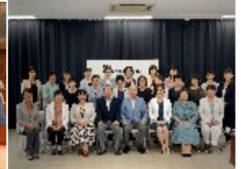
岡山県下市議会議員女性の会