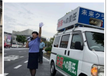
《議会報告街頭演説》