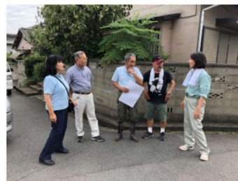
《菅生学区内の視察》

その中でも、災害公営住宅が不足する場合には、民間の賃貸住宅を活用するとの答弁や、聴覚障がい者の方にはスカーフが配布される意向が示されました。